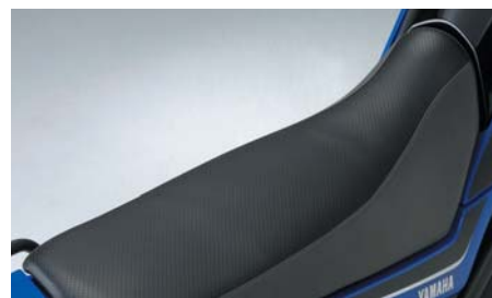
ツーリングシート