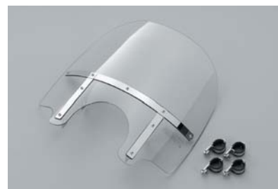
ウインドシールド