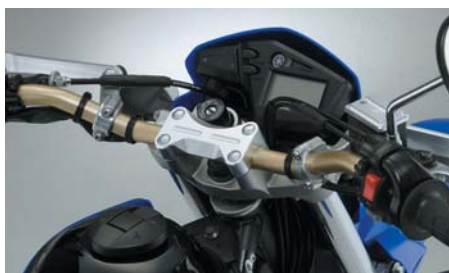
ハンドルバー ゴールド