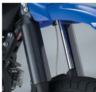
フロントフォークガード